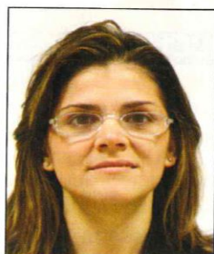
Foto con occhiali corretta