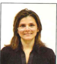
Montatura che taglia gli occhi