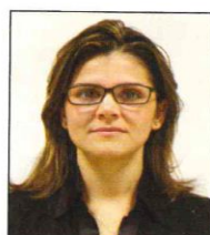
Montatura troppo pesante