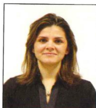
Posizione non corretta