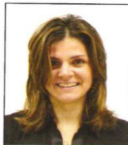
Capelli sugli occhi