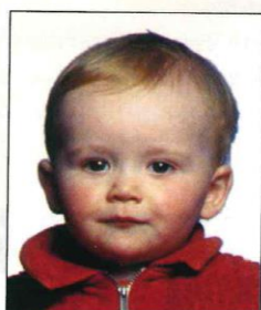
Foto bambino corretta