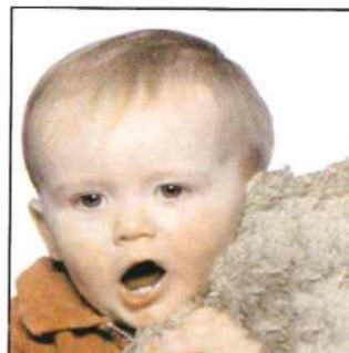
Bocca aperta o giocattolo inquadrato