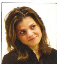
Occhi non orizzontali (viso inclinato)