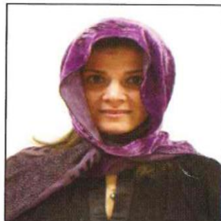
Ombra di velo sul viso