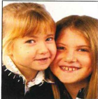
Seconda persona sullo sfondo